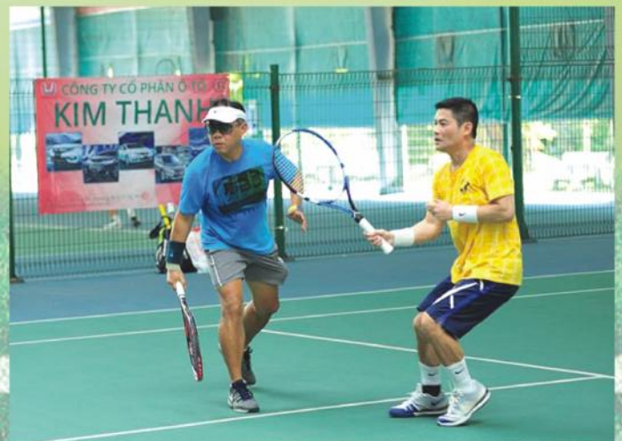
Quyết liệt tranh tài