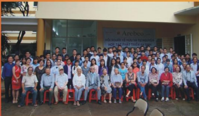
Các bạn học sinh, sinh viên nhận học bổng chụp hình lưu niệm với Hội Arebco