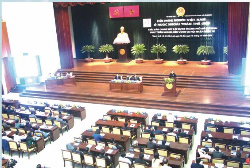
Quang cảnh Hội nghị Người Việt Nam ở nước ngoài toàn thế giới