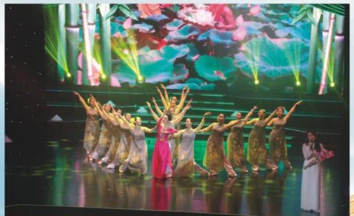
Một tiết mục văn nghệ phục vụ kiều bào