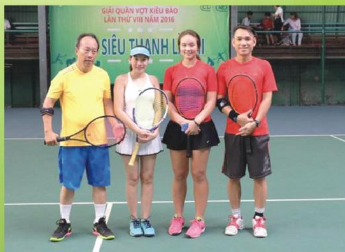
Hai cặp vận động viên (đôi nam nữ) giao lưu trước khi vào trận