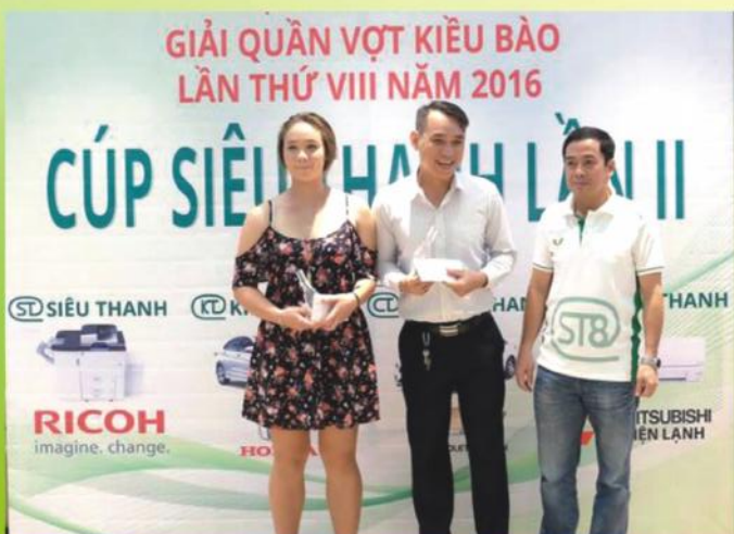
Đại diện nhà tài trợ trao giải nhất đôi nam nữ