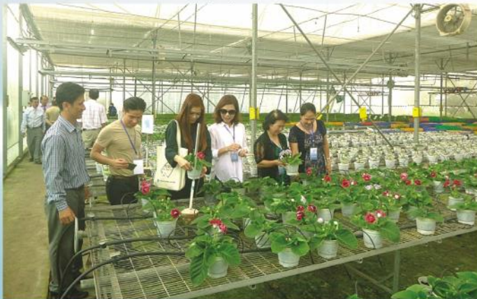
Kiều bào tham quan thực tế tại Trung tâm công nghệ sinh học Thành phố Hồ Chí Minh