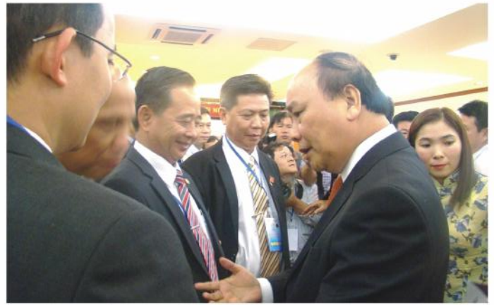
Ông Nguyễn Xuân Phúc, Thủ tướng Chính phủ thăm hỏi kiều bào