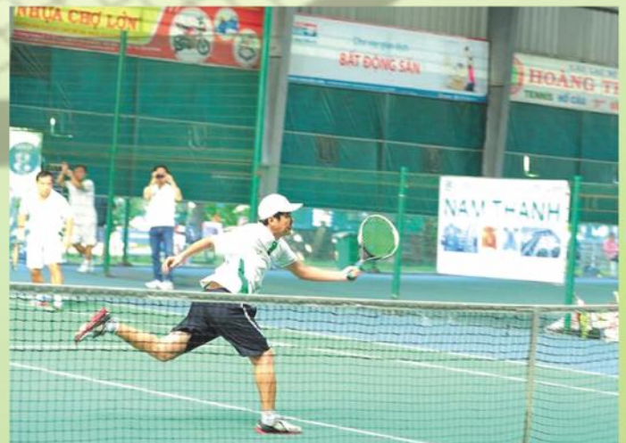
Quyết liệt tranh tài