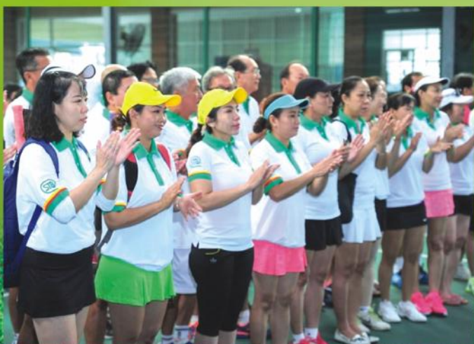
Các vận động viên tham gia thi đấu