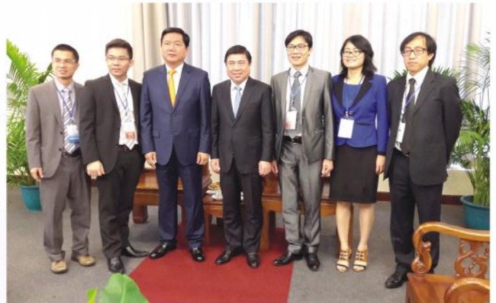
Ông Đinh La Thăng, Bí thư Thành ủy và ông Nguyễn Thành Phong, Chủ tịch UBND Thành phố chụp hình lưu niệm sau buổi gặp gỡ kiều bào