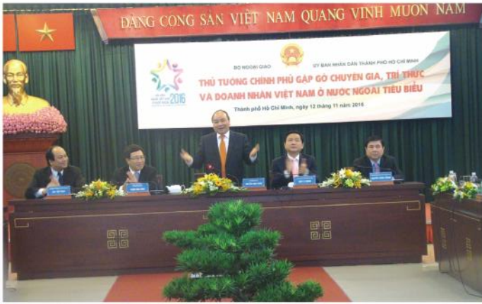
Ông Nguyễn Xuân Phúc - Thủ tướng Chính phủ, ông Đinh La Thăng - Bí thư Thành ủy và ông Nguyễn Thành Phong - Chủ tịch UBND Thành phố hoan nghênh ý kiến đóng góp của kiều bào