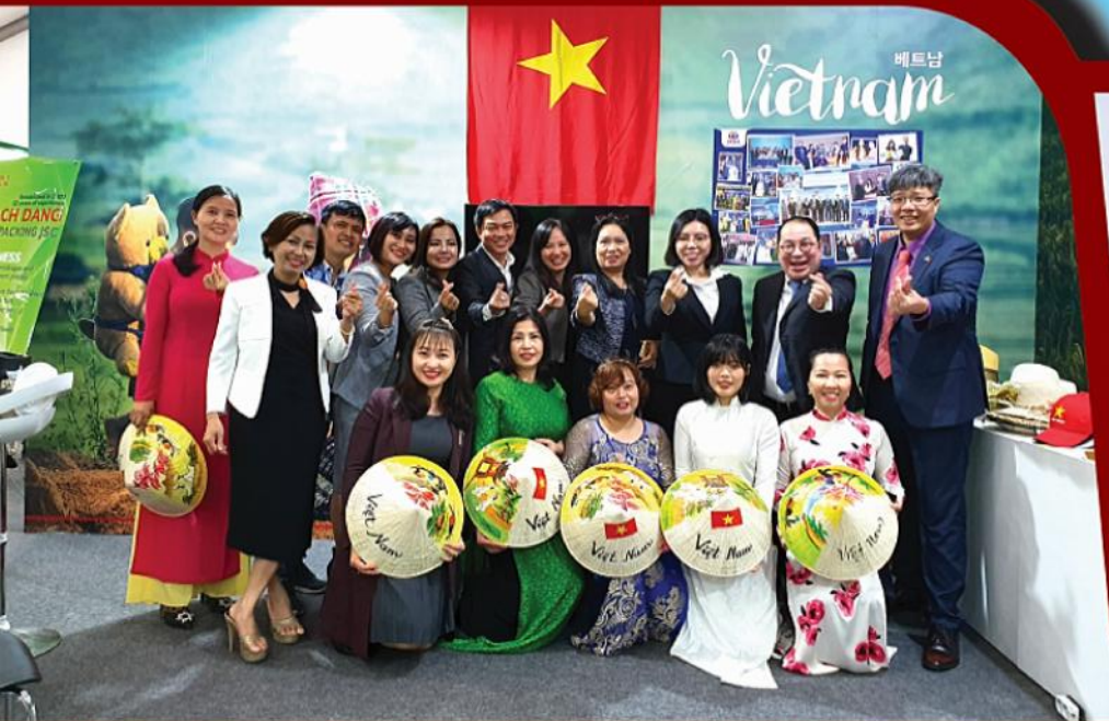
VKBIA và các Doanh nghiệp Nông nghiệp đại diện cho Việt Nam tham dự triển lãm