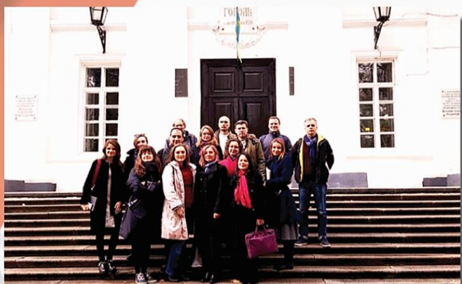
Các nhà văn nhà thơ chụp ảnh kỷ niệm tại trường ĐHTH mang tên Mikola Gogol