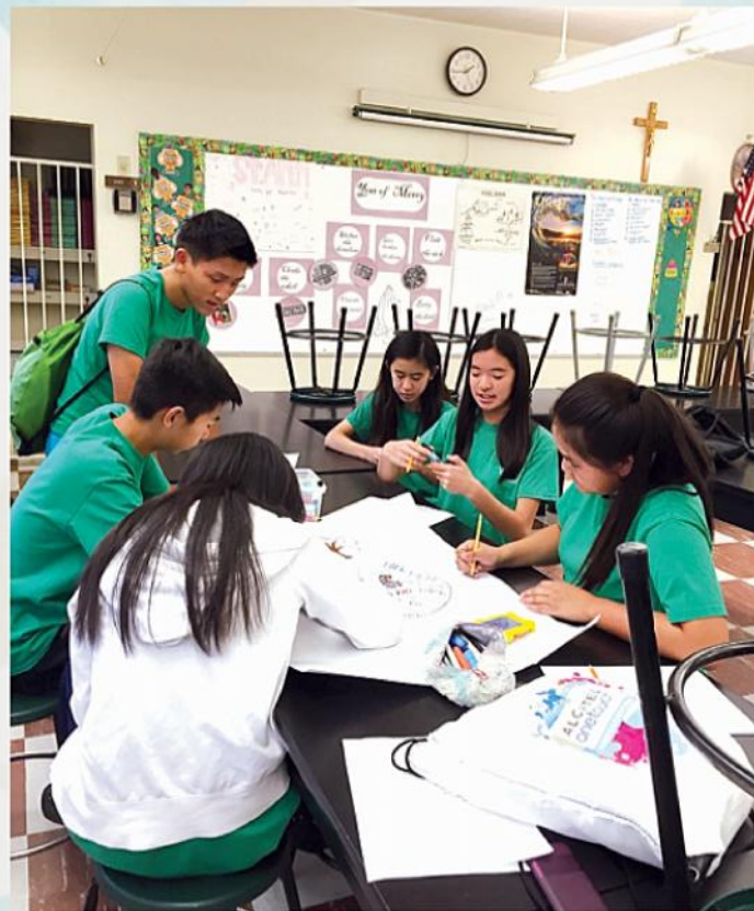
Các em học sinh lớp 6 Việt ngữ trong giờ thực tập bài học tiếng Việt

Hè đến, Thầy Cô tham gia các lớp tu nghiệp sư phạm. Trung tâm tổ chức các lớp bồi dưỡng kiến thức cho Thầy Cô. Chúng tôi chọn các lớp phù hợp, nhằm giúp mình dạy các em tốt hơn. Qua các khóa tu nghiệp này đã giúp Thầy Cô của các trường thống nhất được phương pháp dạy Tiếng Việt cho các em. Từ đó, chúng tôi giao lưu, chia sẻ những