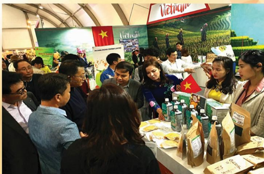
Gian hàng của Việt Nam luôn thu hút đặc biệt đến khách tham quan

Trong khuôn khổ IAE 2019, Hiệp Hội Doanh nhân và Đầu tư Việt Nam - Hàn Quốc (VKBIA) cũng là đơn vị duy nhất ký bản MOU hợp tác toàn diện với Viện Kỹ thuật Nông nghiệp Jeollanamdo - Hàn Quốc nhằm mở cánh cửa mới cho Nông sản Việt và các sản phẩm R&D vào thị trường Hàn Quốc và thế giới. VKBIA ký biên bản hợp tác với Câu lạc bộ Doanh nhân Đồng bằng Sông Cửu Long (Việt Nam) và Văn phòng Hợp tác Kinh tế Việt - Hàn (tỉnh Hậu Giang) để phối hợp và hỗ trợ tăng cường giao thương Việt - Hàn.