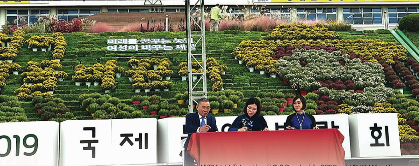
VKBIA ký kết hợp tác với CLB Doanh nhân ĐBSCL và VP KT Việt - Hàn