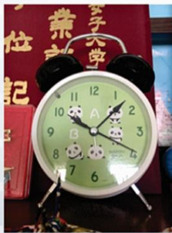
Tôn trọng thời gian

Thứ nhất, người Nhật là người biết tôn trọng thời gian. Khi làm việc với người Nhật thì chúng ta phải đúng giờ. Nếu người Nhật luôn đúng