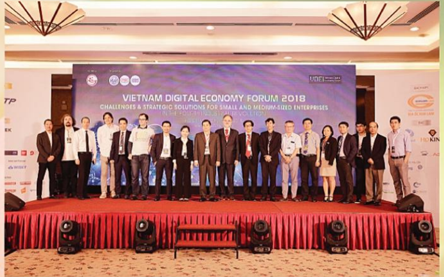
Các diễn giả tham dự Diễn đàn Kinh tế số Việt Nam năm 2018