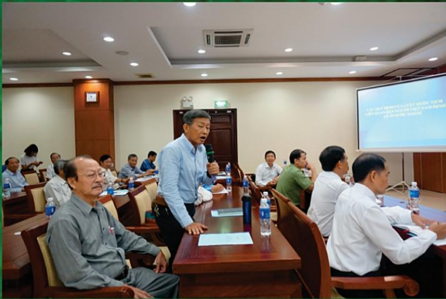
Kiều bào đặt câu hỏi cho báo cáo viên tại Hội nghị phổ biến Luật Quốc tịch 2008