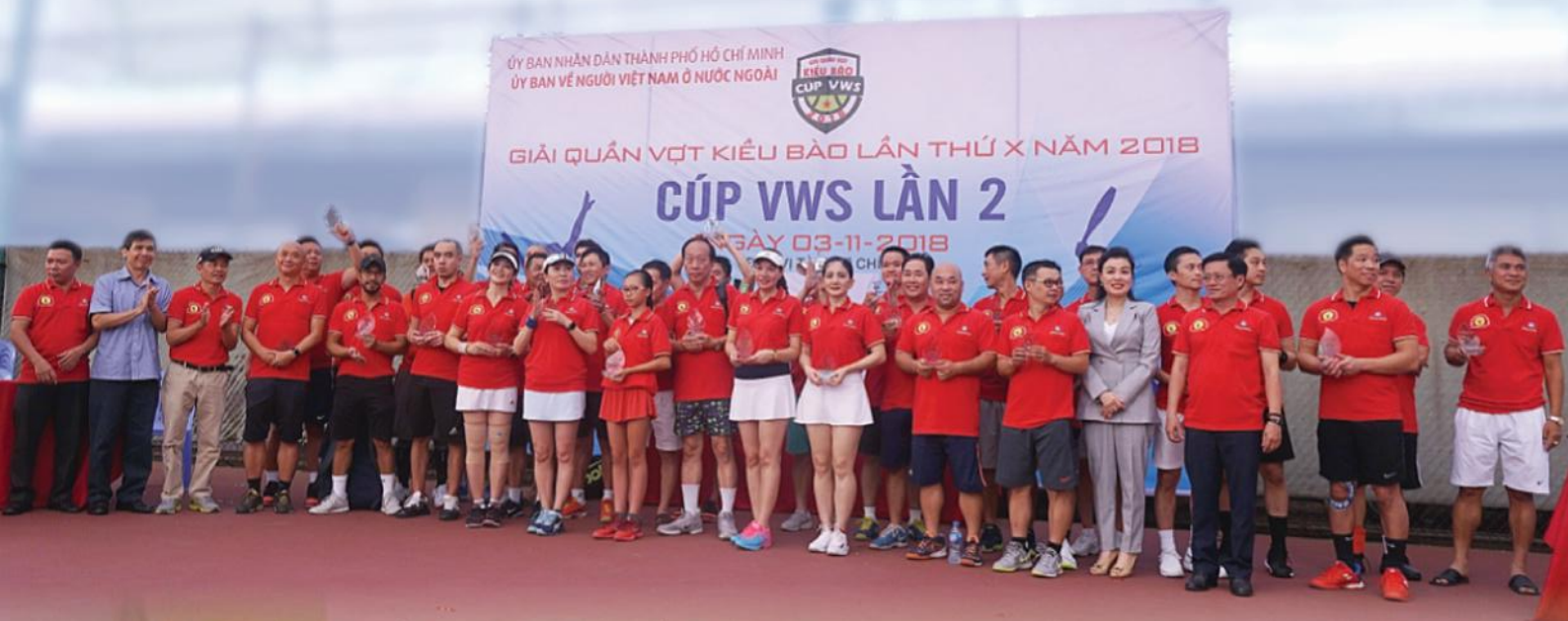
Các vận động viên và Ban tổ chức chụp hình lưu niệm trước giờ thi đấu