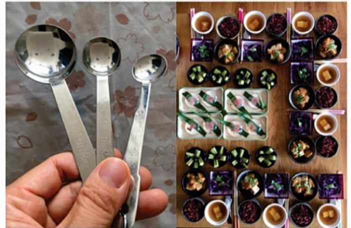
Định lượng thức ăn, và sự thống nhất theo nguyên tắc trước sau như một của người Nhật.

Thứ hai, tôn trọng nguyên tắc. Bản thân con người chúng ta khi làm việc phải có nguyên tắc rõ ràng, khi đặt ra nguyên tắc thì phải tuyệt đối tuân theo, như vậy mới được mọi người tôn trọng. Người Việt Nam chúng ta luôn thích hàng Nhật vì hàng Nhật chất lượng cao, mẫu mã đẹp, an toàn khi sử dụng khiến chúng ta tin tưởng. Nhưng để làm được hàng hóa chất lượng cao, người Nhật đã tôn trọng nguyên tắc một cách nghiêm ngặt và tỉ mỉ đến từng chi tiết. Chúng ta thường gọi đó là tiêu chuẩn