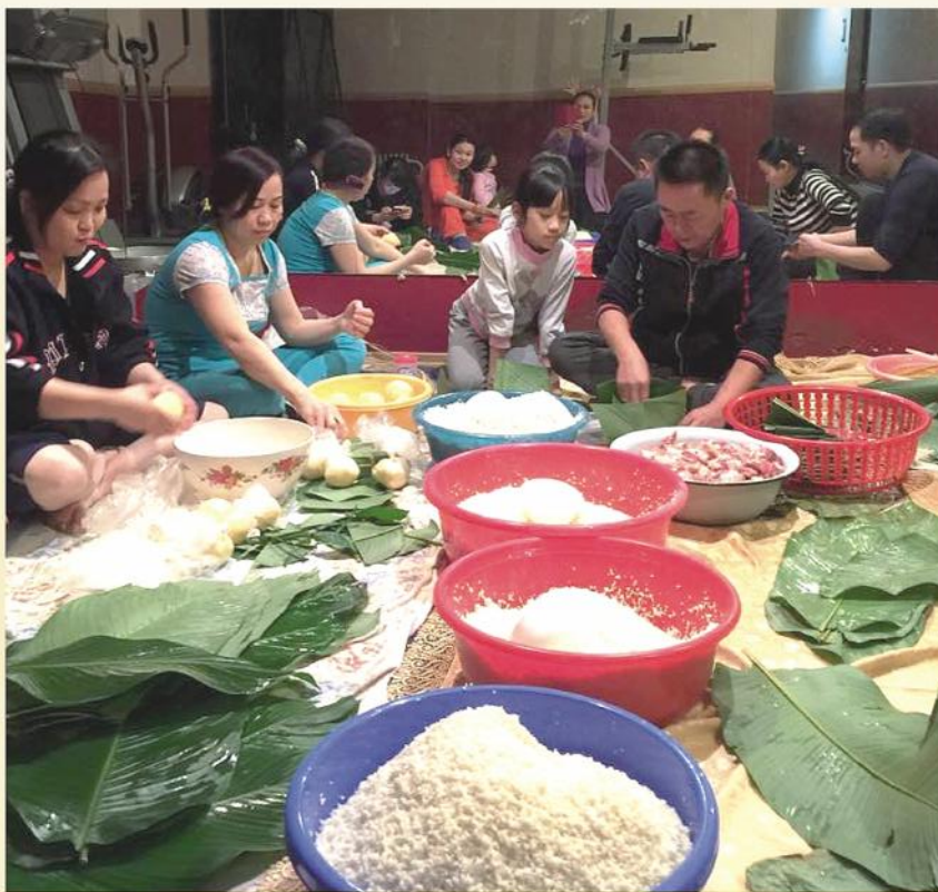
Làng Thời đại gói bánh chưng