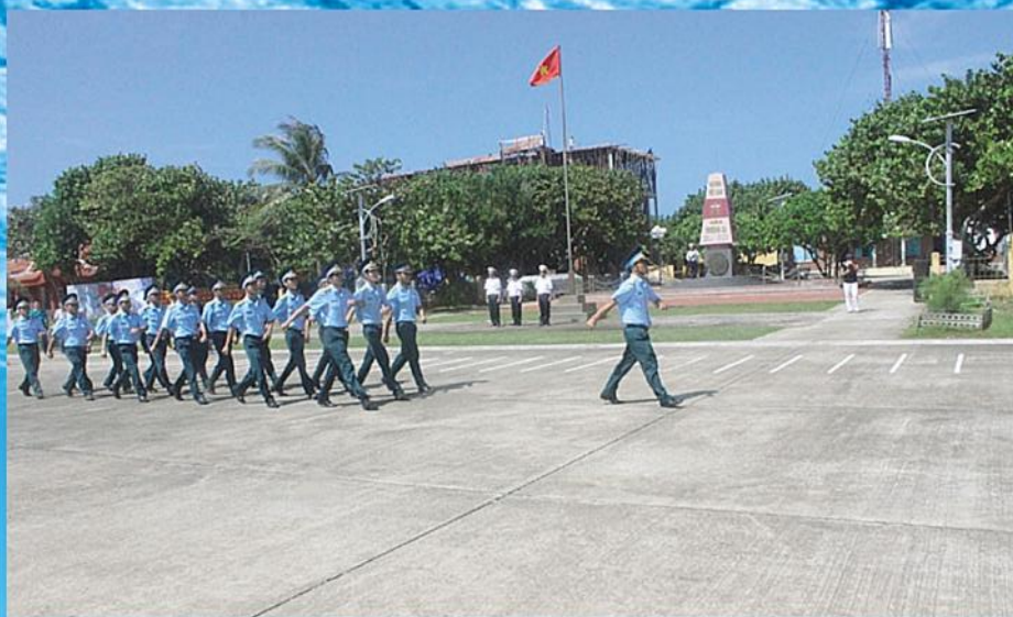
Cán bộ, chiến sĩ lực lượng Phòng không - Không quân tham gia đội hình duyệt binh ở Trường Sa