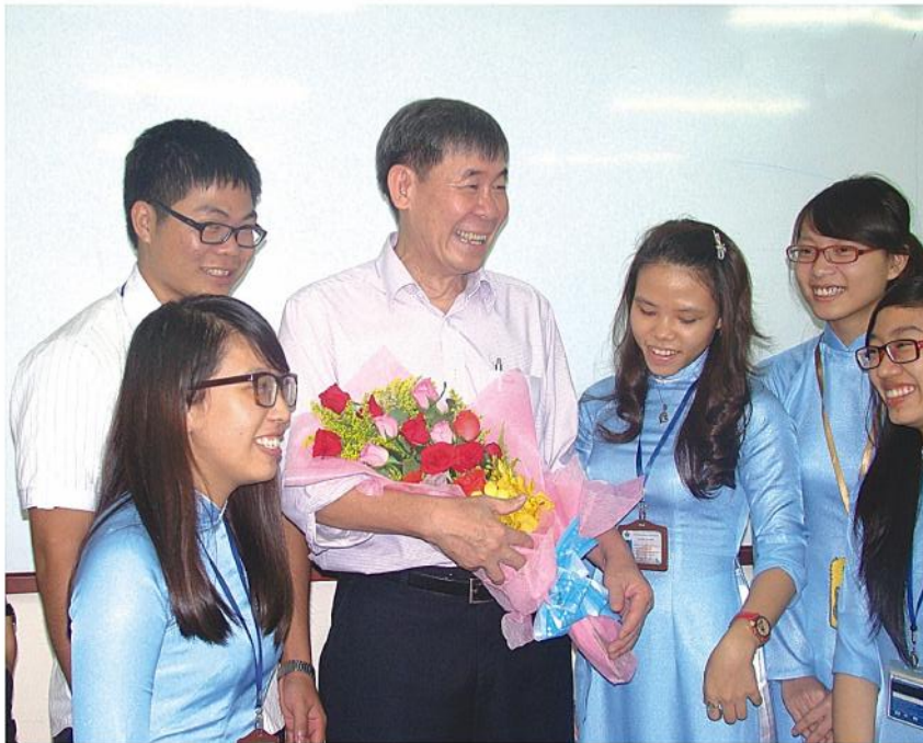
Sinh viên Trường Đại học Quốc tế tặng hoa cho GS.TS Võ Văn Tới, kiều bào Mỹ

V ào ngày 20/11, các thế hệ học sinh trên cả nước thường tặng hoa và quà chúc mừng các thầy cô giáo. Ngành giáo dục cũng thường nhân dịp này đánh giá lại hoạt động giáo dục và lập phương hướng nâng cao chất lượng giáo dục.