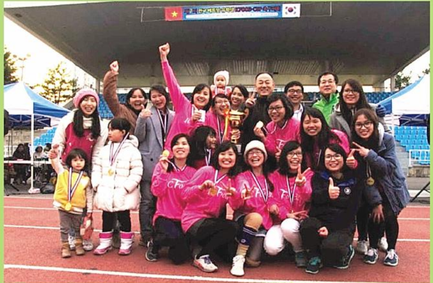
Trao Huy chương vàng cho Đội Bóng đá nữ vô địch

phát biểu khai mạc: "Chúng tôi đánh giá cao và mong muốn Công ty ICFOOD tiếp tục đồng hành hỗ trợ cộng đồng và sinh viên Việt Nam tại Hàn Quốc ngày càng có cuộc sống ổn định, hạnh phúc trong sự hòa đồng với xã hội sở tại và cùng với người dân Hàn Quốc có những đóng góp phát triển hơn nữa quan hệ Việt - Hàn trong bối cảnh quan hệ hữu nghị và hợp tác giữa hai nước đã và đang phát triển tốt đẹp trên tất cả mọi lĩnh vực: chính trị, kinh tế, văn hóa xã hội, giáo dục đào tạo, khoa học công nghệ, quốc phòng an ninh cũng như giao lưu giữa nhân dân hai nước"