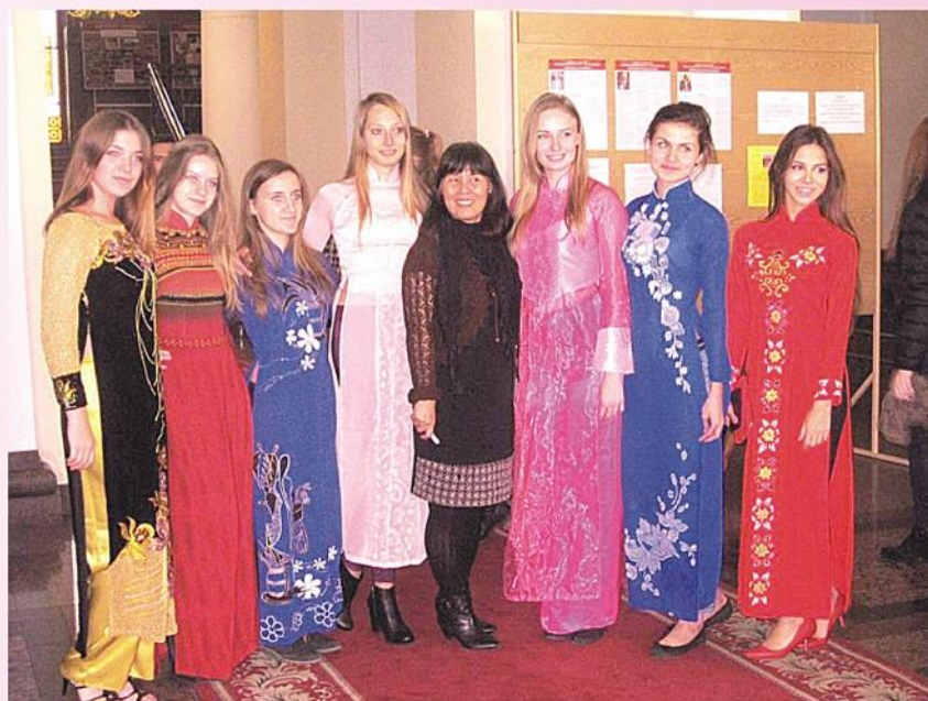
Các sinh viên Ucraina hóa thân trong tà áo dài – nét đẹp văn hóa truyền thống của phụ nữ Việt Nam - Ảnh tư liệu

Cô Vân Anh cũng cho biết thêm: Hiện nay tổ bộ môn tiếng Việt gồm có 5 giáo viên – 2 giáo viên người