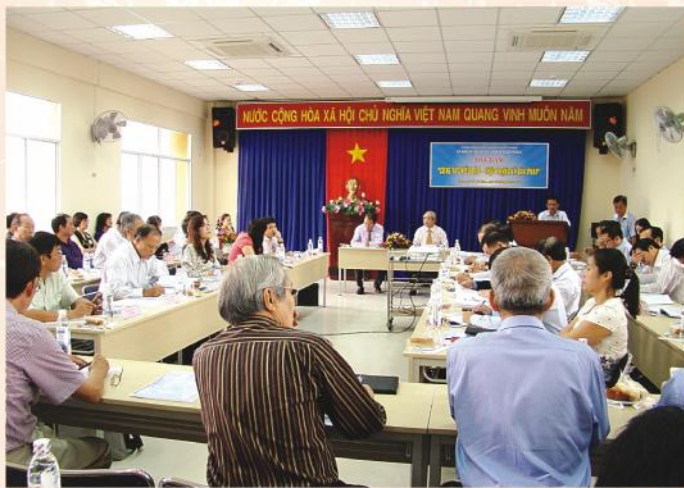
Quang cảnh buổi tọa đàm "Công tác kiều bào – thực trạng và giải pháp"