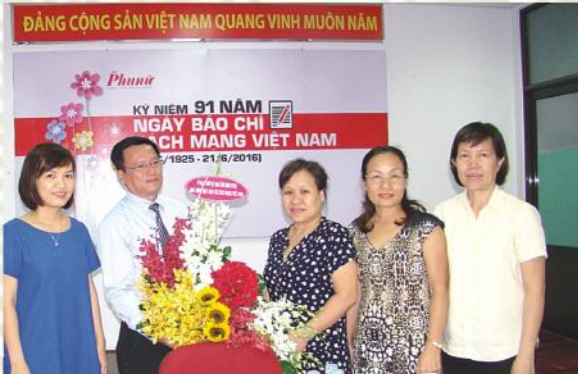
Thăm và chúc mừng Báo Phụ nữ Thành phố

Dưới đây là một số hình ảnh của chuyến thăm chúc mừng ngày Báo chí Cách mạng Việt Nam: