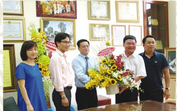
Thăm và chúc mừng Báo Công an Thành phố