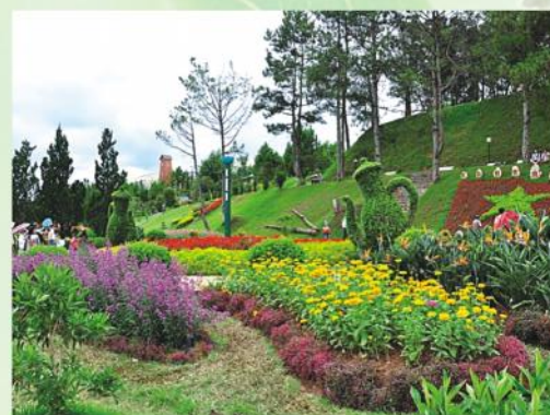
Đà Lạt - Thành phố ngàn hoa