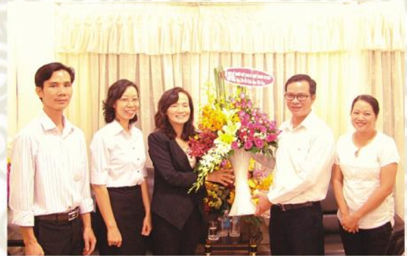
Thăm và chúc mừng Đài Tiếng nói Nhân dân TP.HCM