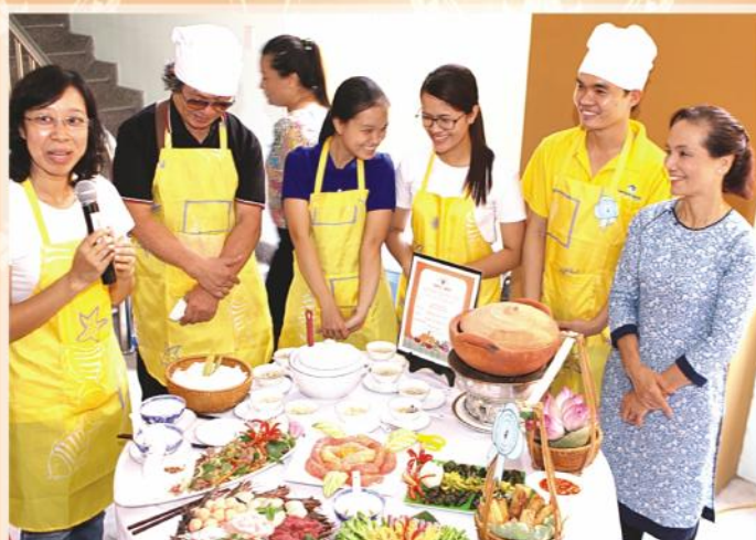
Phản trình bày các món ăn và thuyết trình của đội thi đạt giải nhất