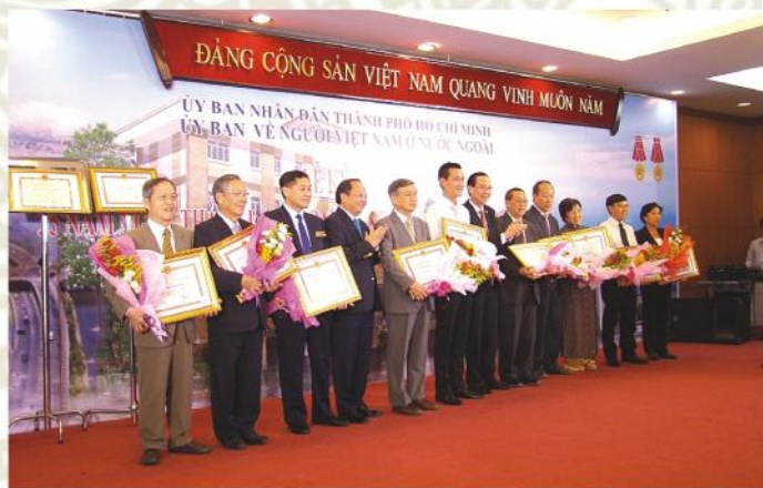
Ông Tắt Thành Cang, Phó Bí thư Thường trực Thành ủy TPHCM tặng bằng khen của UBND TP cho kiểu bào có thành tích đóng góp cho sự phát triển Thành phố

K hông phải tới giải phóng miền Nam, giải phóng Sài Gòn chúng ta mới đặt ra công tác kiểu bào mà ông cha ta và Bác Hồ, Đảng ta đã làm từ trước và sau khi có Đảng. Đến ngày 8 tháng 6 năm 1981, do yêu cầu thực tế của tình hình và chủ trương của Đảng và Nhà nước trong công tác kiểu bào, UBND Thành phố đã thành lập Ban Việt kiều Thành phố (BVK.TP), đến tháng 12/1994 đổi tên thành Ủy ban về Người Việt Nam ở nước ngoài (UBVNVNONN.TP) trực thuộc Ủy ban nhân dân Thành phố. Công việc chính của thời kỳ này là vận động kiểu bào trở về thăm quê hương đất nước sau nhiều năm bị lệ thuộc và bị chiến tranh tàn phá, cũng như thăm các di tích lịch sử, các chứng tích chiến tranh, chiến thắng 30 tháng 4 lịch sử, thăm lại quê cha đất Tổ. Đặc biệt, việc nổi