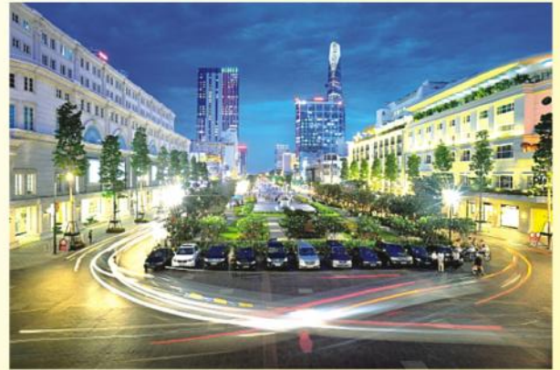
Quảng trường, phố đi bộ đường Nguyễn Huệ

Mời xem chi tiết chương trình trại hè ở trang 15