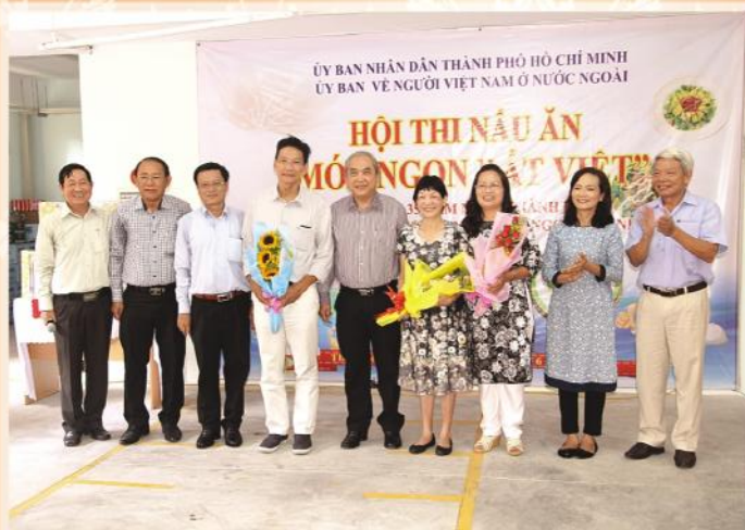
Ban tổ chức tặng hoa cho Ban Giám khảo Hội thi Món ngon đất Việt