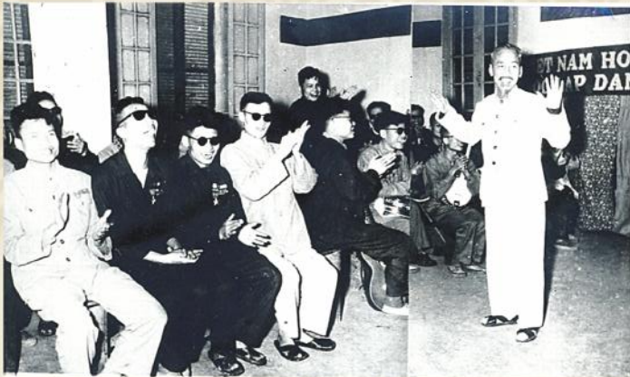
Bác Hồ luôn trân trọng những đóng góp của thương binh liệt sĩ trong cuộc chiến tranh bảo vệ Tổ Quốc

C uộc kháng chiến toàn quốc chống Pháp đã thu hút nhiều thanh niên nam nữ tham gia quân đội. Một số chiến sĩ đã hy sinh anh dũng, một số nữa là thương binh, bệnh binh, đời sống gặp nhiều khó khăn, mặc dầu anh chị em tình nguyện chịu đựng không kêu ca, phàn nàn.