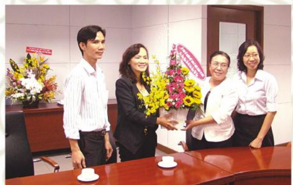
Thăm và chúc mừng Báo Pháp Luật Thành phố