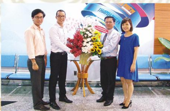
Thăm và chúc mừng Báo Thanh Niên