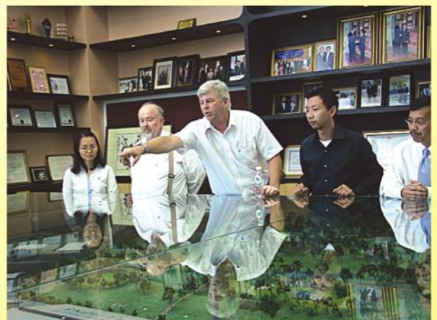
Tham quan công ty kiều bào có đóng góp tích cực trong sự phát triển của Thành phố