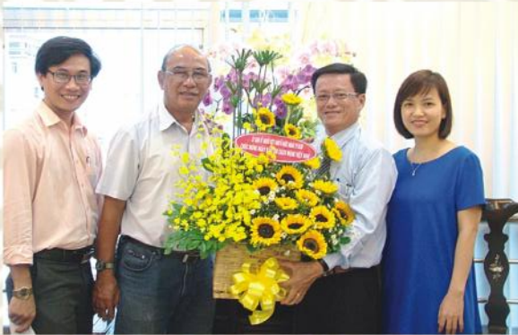
Thăm và chúc mừng Báo Người Lao Động