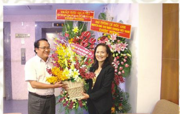
Thăm và chúc mừng Báo Tuổi Trẻ