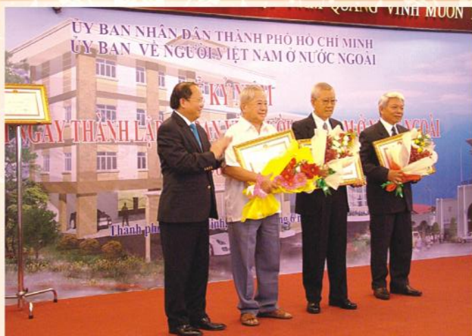
Ông Tất Thành Cang, Phó Bí thư Thường trực Thành ủy TPHCM tặng bằng khen của UBND TP cho lãnh đạo các thời kỳ