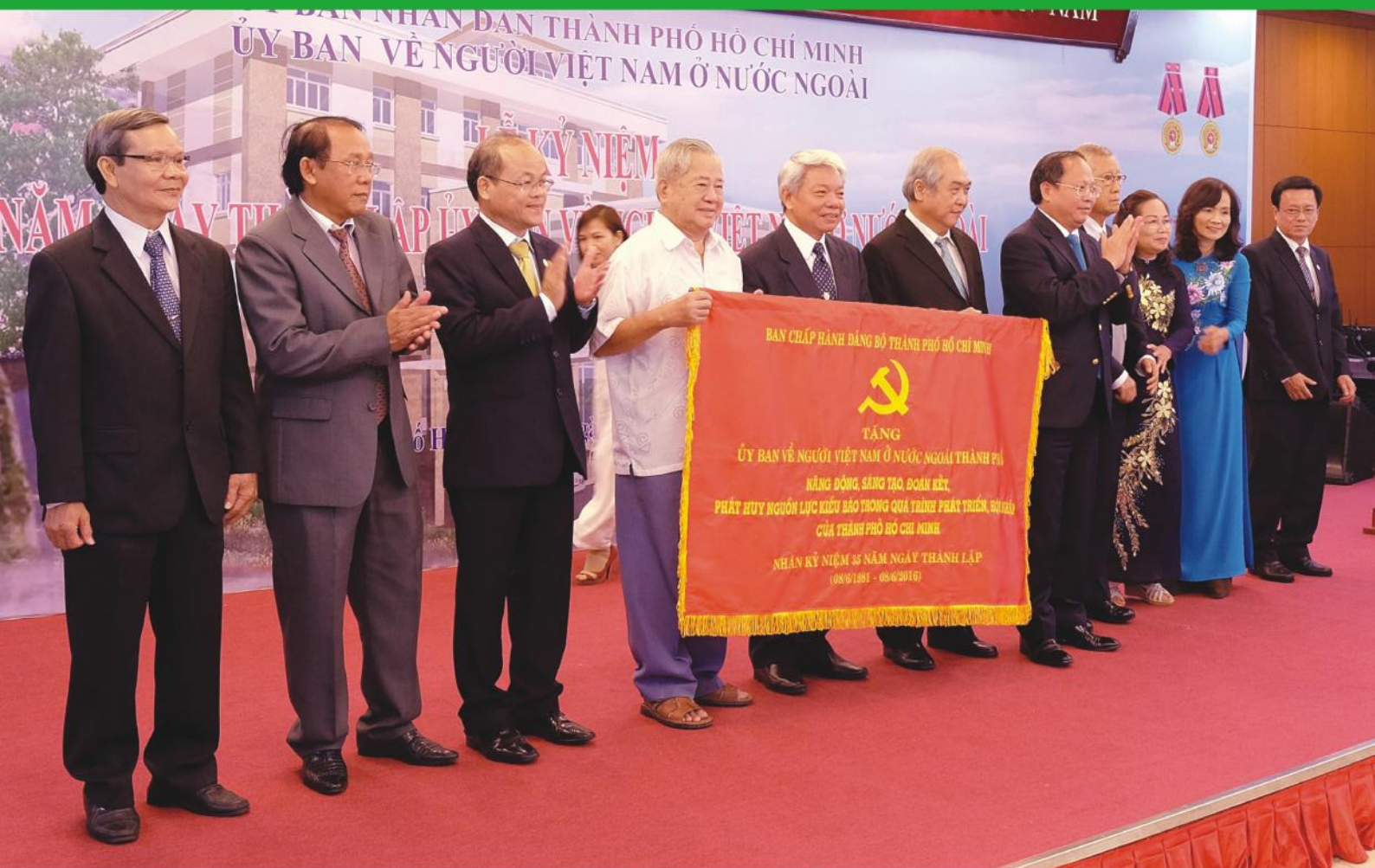
Lãnh đạo Ủy ban về người Việt Nam ở nước ngoài Thành phố các thời kỳ đón nhận bức trường của Ban Chấp hành Đảng bộ Thành phố