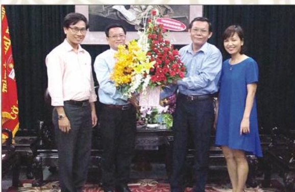
Thăm và chúc mừng Báo Sài Gòn Giải Phóng