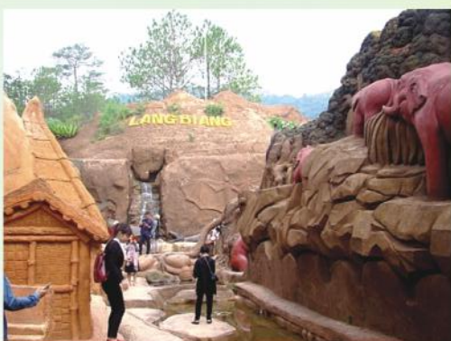
Đường hầm điêu khắc nơi tái hiện một Đà Lạt từ hoang sơ đến thành phố du lịch

độc đáo và đồ sộ, tìm hiểu về nền văn hóa công nghệ Tây Nguyên thật đặc sắc của cộng đồng dân tộc thiểu số cùng với những làng nghề truyền thống vốn đã xuất hiện từ rất lâu đời.