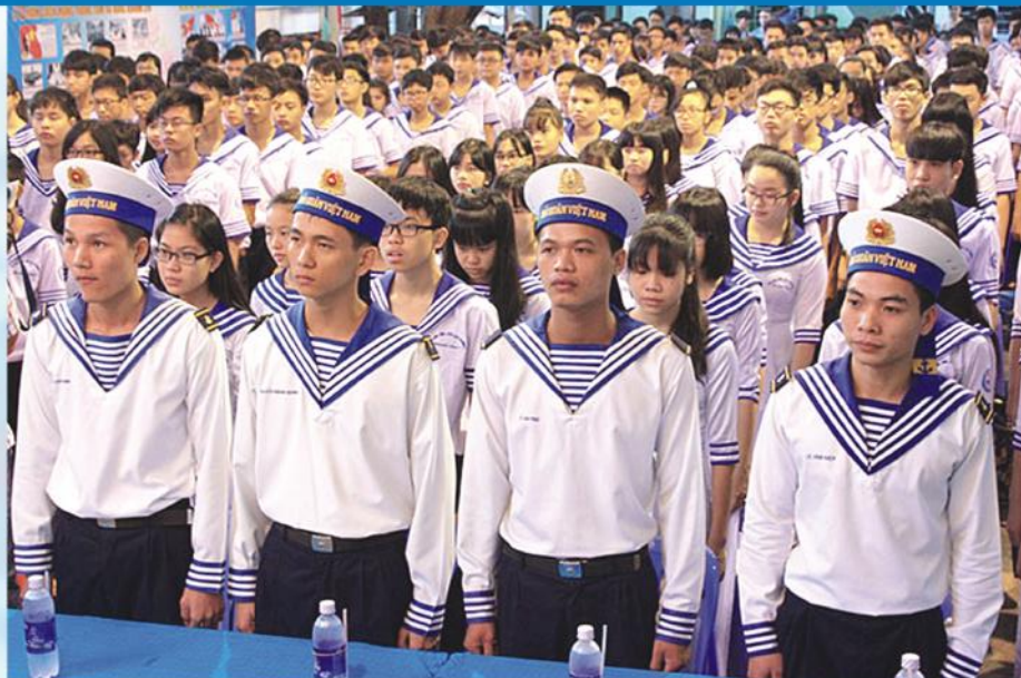
Buổi lễ khai giảng của trường THPT Nhân Việt có các chiến sĩ hải quân Việt Nam tham dự