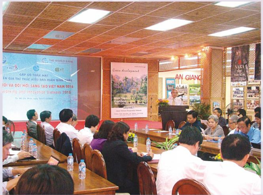
Bộ trưởng Bộ Khoa học và Công nghệ Nguyễn Quân phát biểu tại buổi họp mặt

Phát biểu tại buổi gặp gỡ, Bộ trưởng Nguyễn Quân đánh giá cao vai trò và những đóng góp tích cực của các chuyên gia trí thức kiều bào trong những năm qua, góp phần vào sự phát triển chung của nền khoa học – công nghệ (KH-CN) Việt Nam. Bên cạnh đó, Bộ trưởng cũng thông tin nhiều chính sách mới của Đảng và Nhà nước trên lĩnh vực kinh tế, khoa học, công nghệ. Đây là cơ sở pháp lý để các nhà doanh nghiệp, các nhà khoa học Việt Nam ở nước ngoài có nhiều thuận lợi để đầu tư, nghiên cứu khoa học trong nước. Cụ thể, ngày 15/02 vừa qua, Thông tư 27 của Bộ KH&CN và Bộ Tài chính về cơ chế khoán chi trong hoạt động nghiên cứu khoa học đã chính thức có hiệu lực và mở ra nhiều sự thuận lợi cho hoạt động phát triển KH-CN.